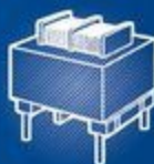
Изделия на ферритах