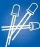
Светодиоды и светильники